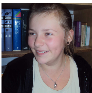
Wywiada z Mamą przeprowadziła Kinga Sitarz

Dziękujemy za udzielenie odpowiedzi na zadane pytania.